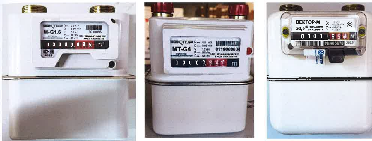
а) исполнения «ВЕКТОР М» и «ВЕКТОР МТ»

Пломбировку изготовителя или поставщика газа осуществляют с помощью проволоки и свинцовой (пластмассовой) пломбы.