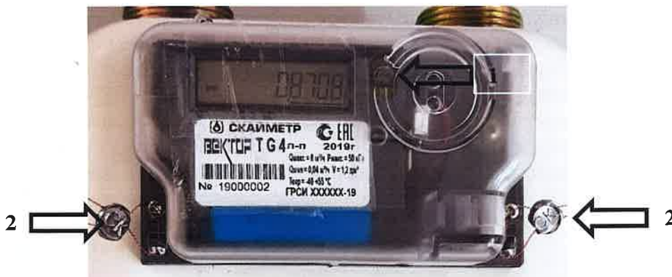
Рисунок 2 – Схема пломбировки от несанкционированного доступа, обозначения места нанесения знака поверки счетчиков газа диафрагменных ВЕКТОР исполнения «ВЕКТОР Т» и «Вектор ТК» (1 – место для установки знака поверки, 2– место для установки пломбы изготовителя или поставщика газа)