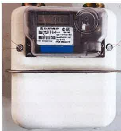
б) исполнения «ВЕКТОР Т» и «Вектор ТК»