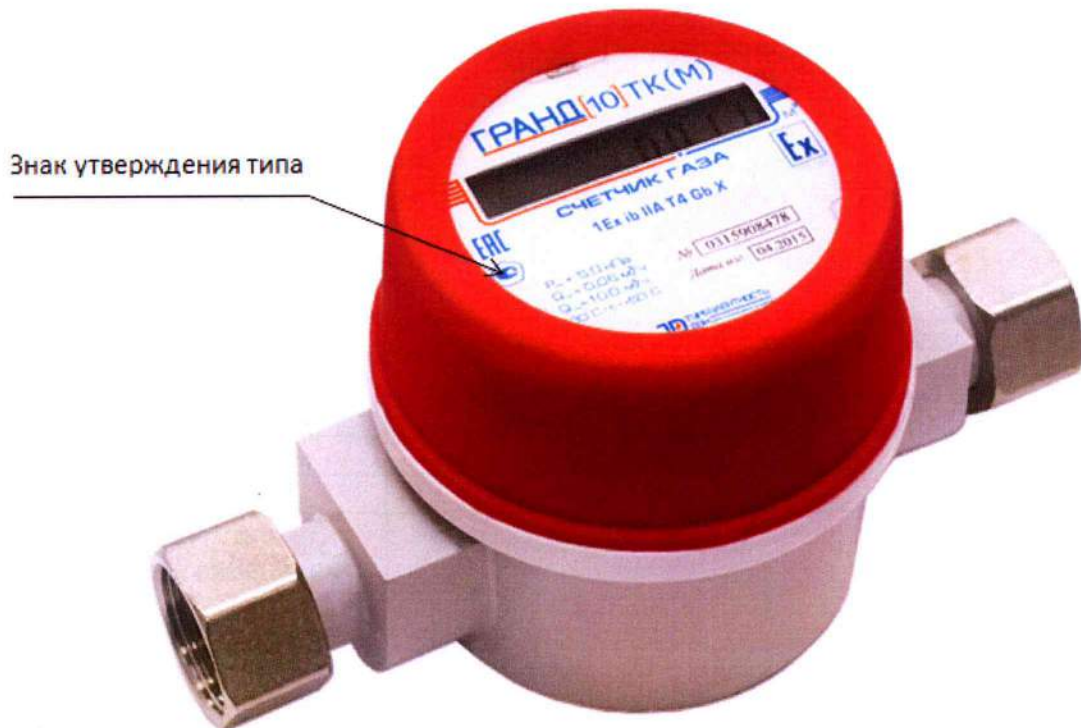
Знак утверждения типа

Общий вид счетчиков представлен на рисунке 1.